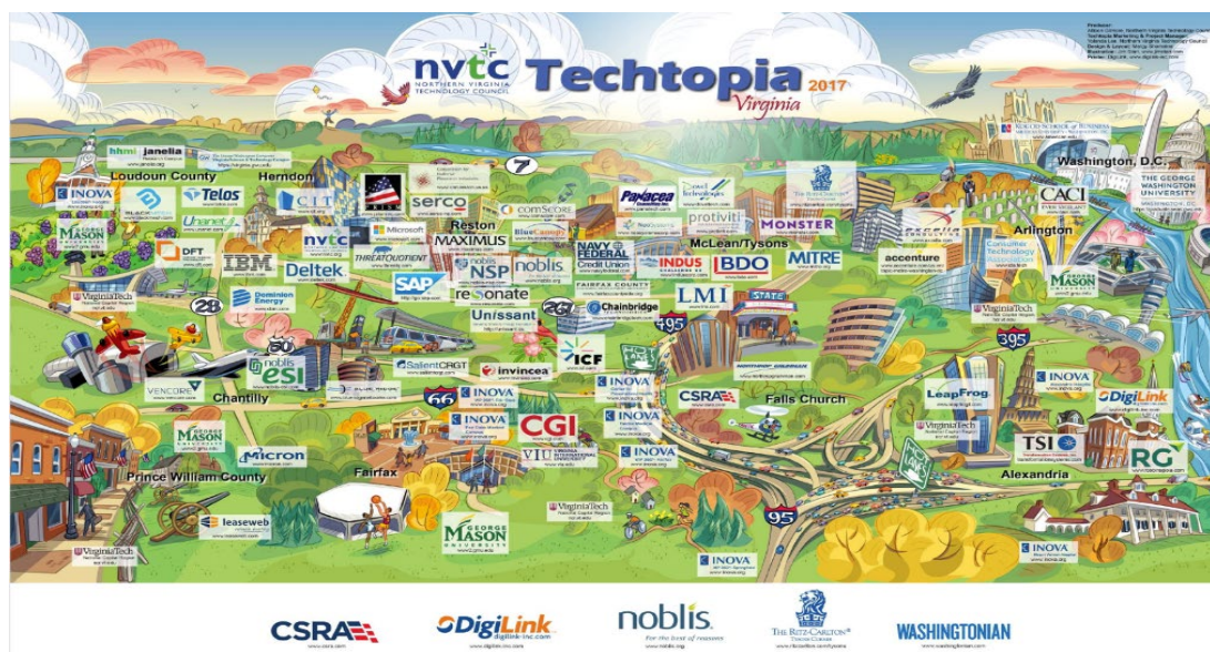
圖 2. Virginia Tech NCR 校區附近知名企業